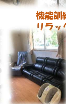
機能訓練もできる リラックスルーム