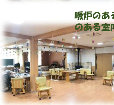
暖炉のある温もり のある室内