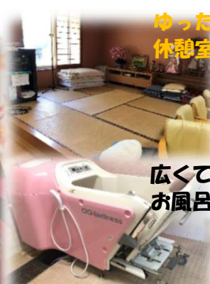
ゆったりとした 休憩室