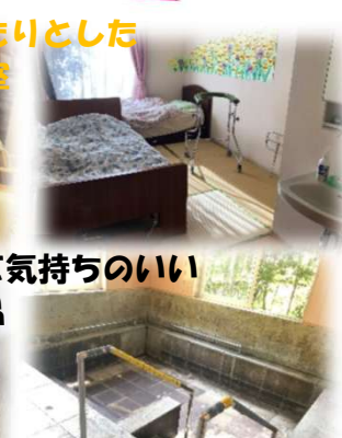
広くて気持ちのいい お風呂