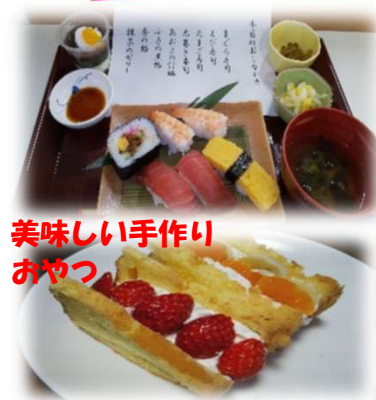
美味しい手作り おやつ